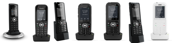
M25 M30 M65 M70 M80 M85 M90