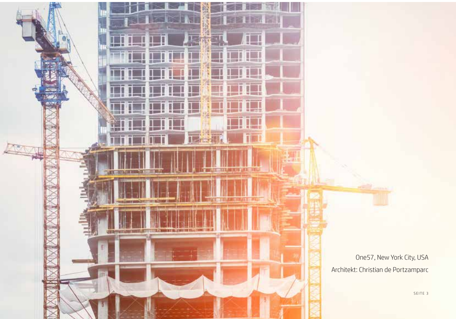
One57, New York City, USA Architekt: Christian de Portzamparc

In wirtschaftlich weiter entwickelten Städten konkurrieren neue Wolkenkratzer oft miteinander, wenn es darum geht, Mieter und Investoren zu gewinnen. Das zwingt Architekten dazu, ambitionierte Entwürfe vorzulegen, die in der Skyline spektakuläre Zeichen setzen. Infolgedessen sind auch die Ingenieure gefragt: Sie müssen Methoden entwickeln, mit deren Hilfe immer ausgefallener Visionen Realität werden können.