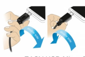
EASY-USB Micro B