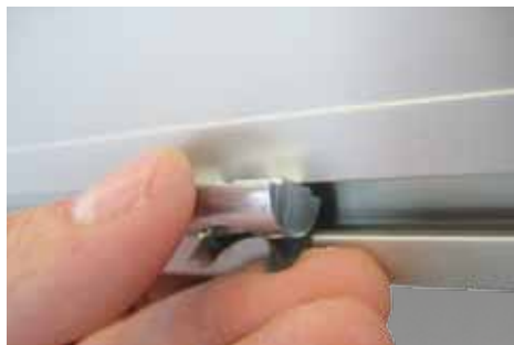
Einbau einer Einschwenkmutter in das Nutensystem auf Rahmenrückseite.