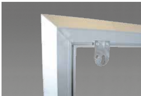
Aufhängepunkt für Wandmontage - horizontal montiert.