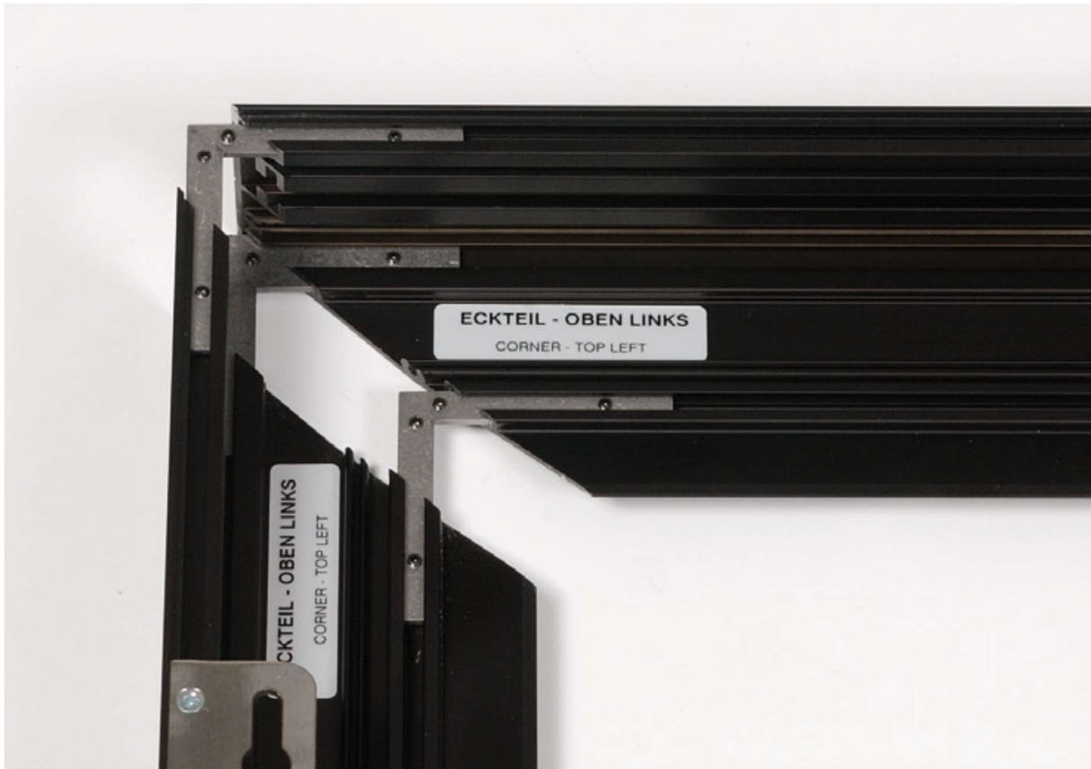
Verbindungswinkel und Nutkanäle