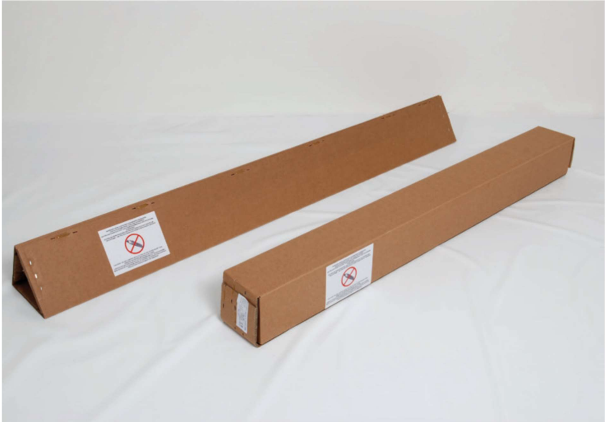
Rahmenelemente und Folie werden separat geliefert.