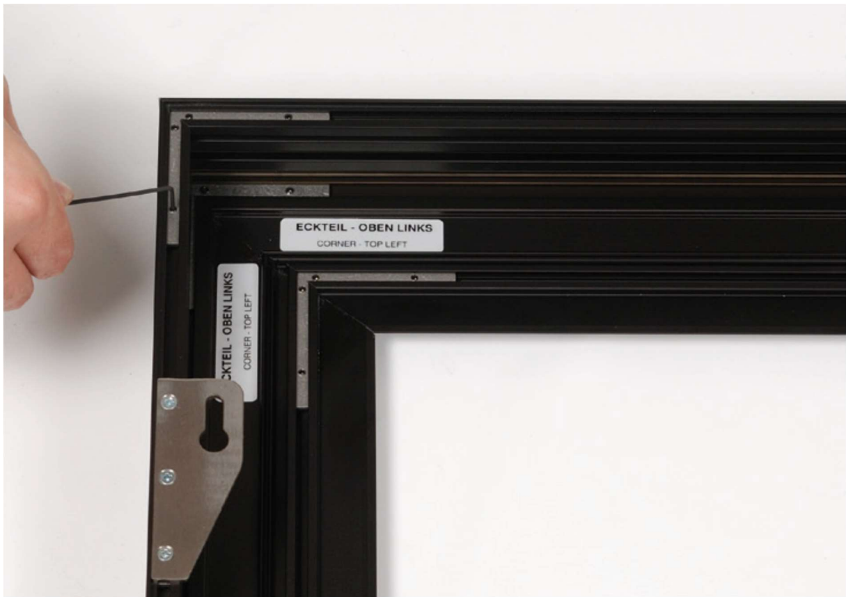
Die Rahmenelemente werden zusammengeschoben und fixiert