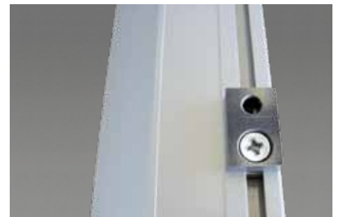
Befestigungspunkt mit M8-Gewindeeinsatz.